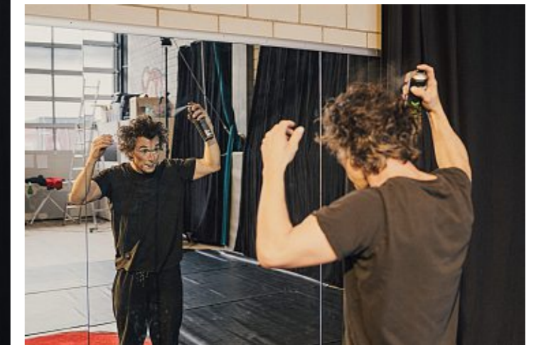
Ordentlich verwuschelt: Bis die zerzauste Frisur sitzt, braucht es viel Haarspray.